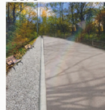
TECNICA: DIGITALE (APP: PICSARD)