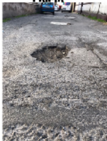
Tor Bella Monaca (municipio VI)