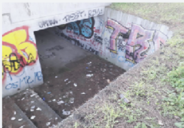
Zona Tor Tre Teste.