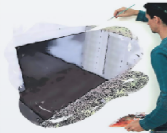
Federico Consorzio IV L Tecnica usata: photoshop