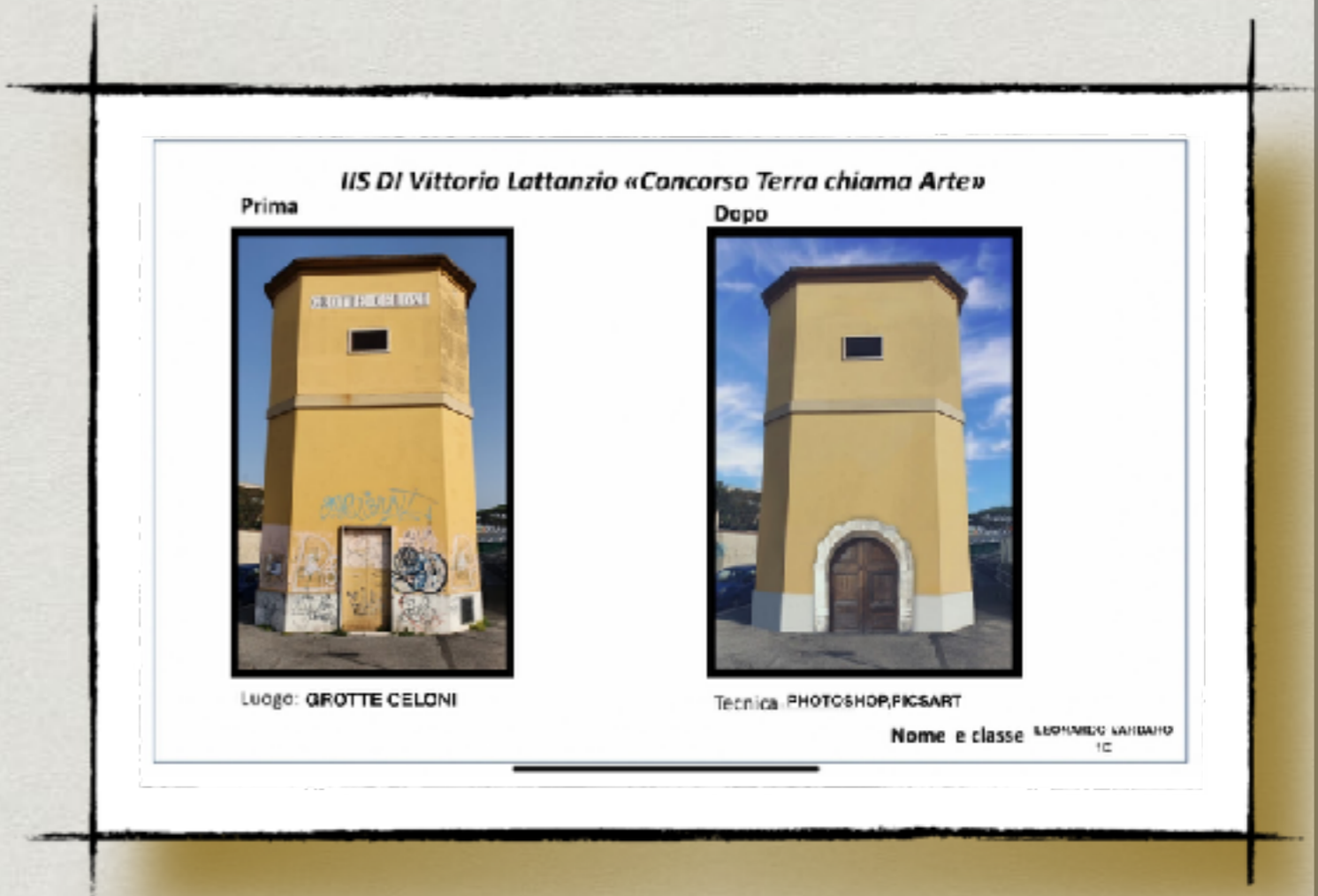
Per la fotografia N.66- Leonardo Vardaro 1E